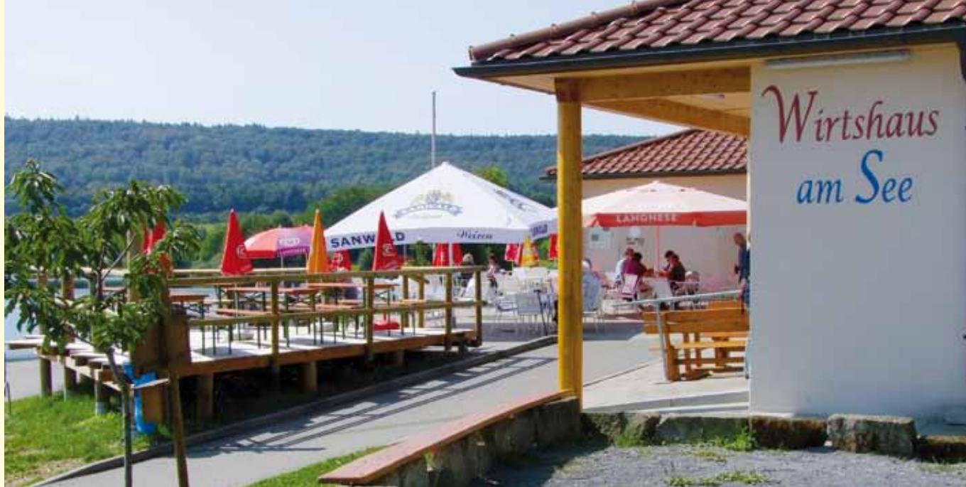
Die gemütliche Terrasse mit Blick auf den See „Ehmetsklinge“